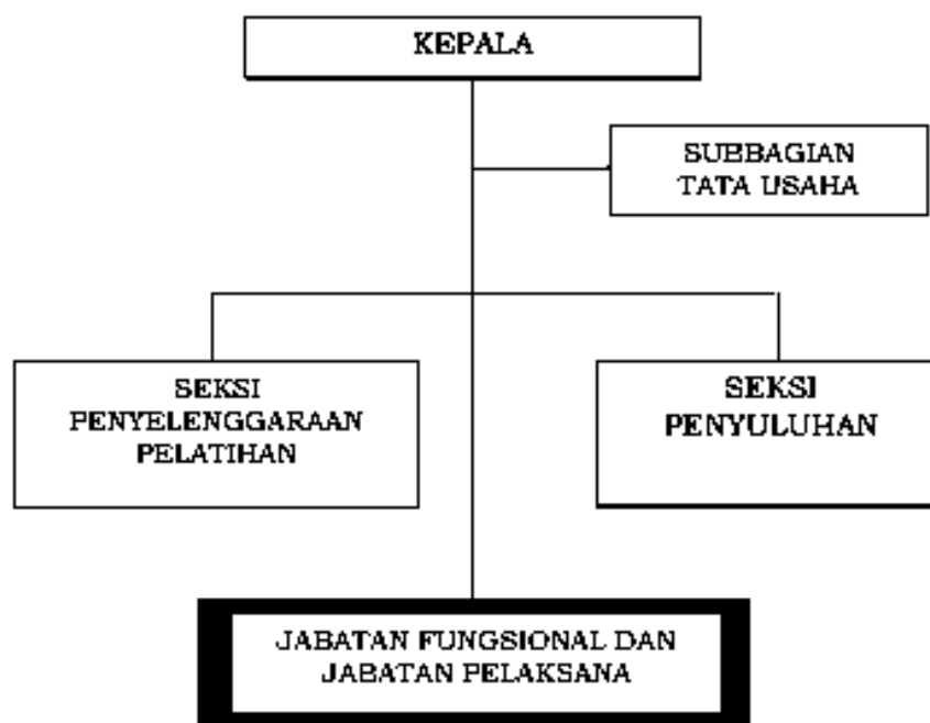
Bagan 1 Struktur Organisasi Balai P2SDM

Untuk mendukung pelaksanaan tugas dan fungsi tersebut, Balai P2SDM Wilayah IV memiliki struktur organisasi yang terdiri atas: